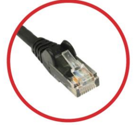
C5E-10-P, C5E-25-P 10ft and 25ft pre-terminated plenum rated Cat 5e cables