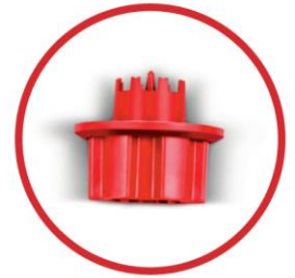
TCM-X Installation Tool Hole saw and driver