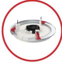
TCM-X-FM Flush Mount Kit