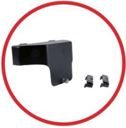
BPAK Backpack adapter kit