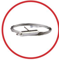
Seismic Cable Adapter Cable adapter for TCM plenum boxes