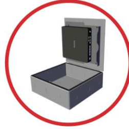
Plenum Box 12x12 Chicago compliant plenum box