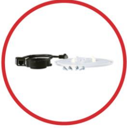
TCM-X-DK Plenum attachment for drywall ceilings