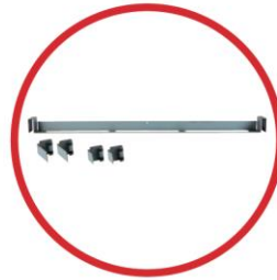
TB-1 Tile bridge for TCM plenum boxes