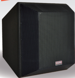
QX396 小型で高出力。 残響に負けない明瞭度。