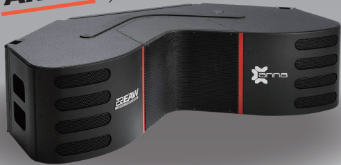
ANNA 3ウェイフルレンジ アレイモジュール。