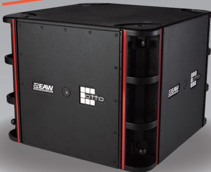
OTTO 低域を自在に操る。 次世代の指向性制御。