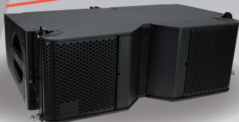
NT206L 14.5kgの軽量。 指向性を工具レスで変更。