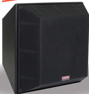
QX596i アリーナ級。 圧倒的なパワーと遠達性。