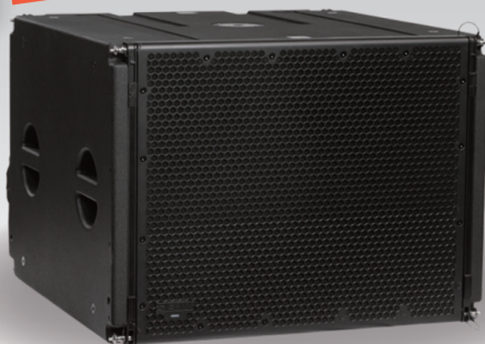
SBX118F 自動認識で設定。 高速設営の18インチ。