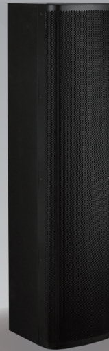
AC6 指向性を自在に。 均一な音を会場全体へ。