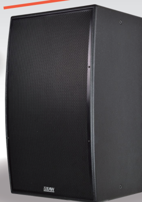
MKD1294 強力な低域。 正確な指向性を維持。